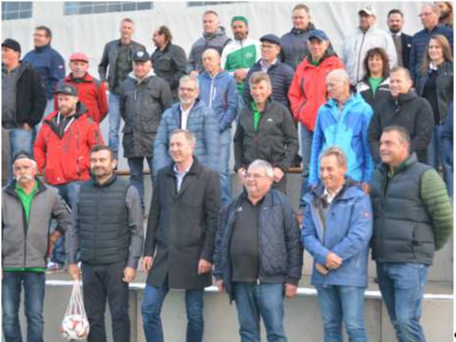
Strahlende Gesichter während der Platzübergabe!